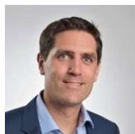
ERFA 1 Christian Rymann Schindler Aufzüge AG